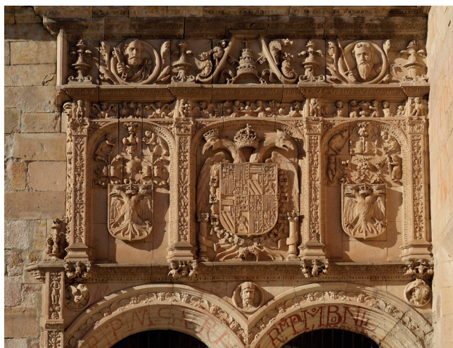
Imagen 5. Detalle de la portada de las Escuelas Menores de la Universidad de Salamanca. C. 1533. Fotografía: Vicente Sierra Puparelli.

La heráldica de la fachada de las Escuelas Menores, construida hacia 1530-33, después de las coronaciones de Bolonia y Aquisgrán, refleja la nueva situación 60 : en el panel central el águila bicéfala sostiene el escudo con las armas plenas de Carlos V rodeado por el collar de la orden del Toisón de Oro. Sus cabezas llevan coronas reales abiertas y entre ellas se sitúa una corona imperial de tres arcos, en alusión a las tres coronaciones medievales: rey de Alemania, rey de Italia y emperador romano. Aquí sí aparece la divisa personal de las Columnas de Hércules en las esquinas inferiores. A ambos lados se sitúan dos escudos iguales que llevan como mueble el águila bicéfala tres veces coronada. Ya no aparece el águila monocéfala, pues el rey de romanos-alemanes era entonces su hermano Fernando de Habsburgo.