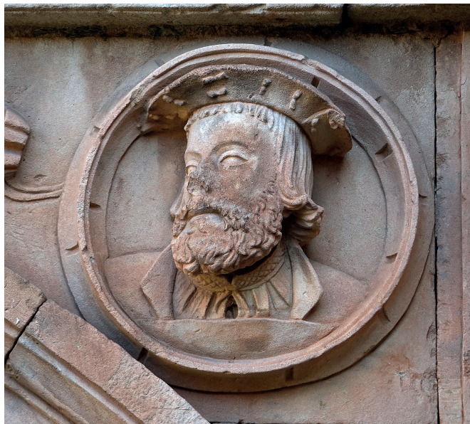
Imagen 6. Medallón de Carlos V en el patio del Colegio del Arzobispo Fonseca. 1533-1534. Salamanca.