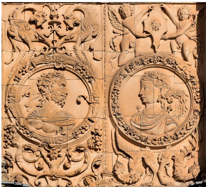
Imagen 4. Medallones en los extremos del segundo cuerpo de la fachada de las Escuelas Mayores.