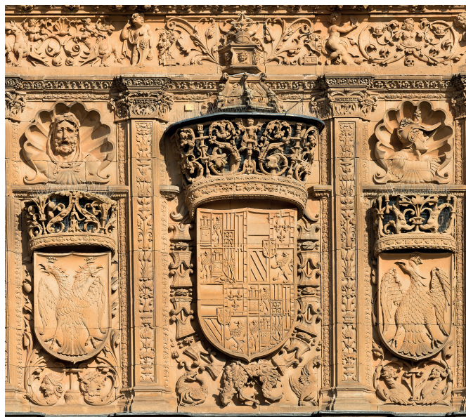
Imagen 3. Escudos reales e imperial en el segundo cuerpo de la fachada de las Escuelas Mayores.