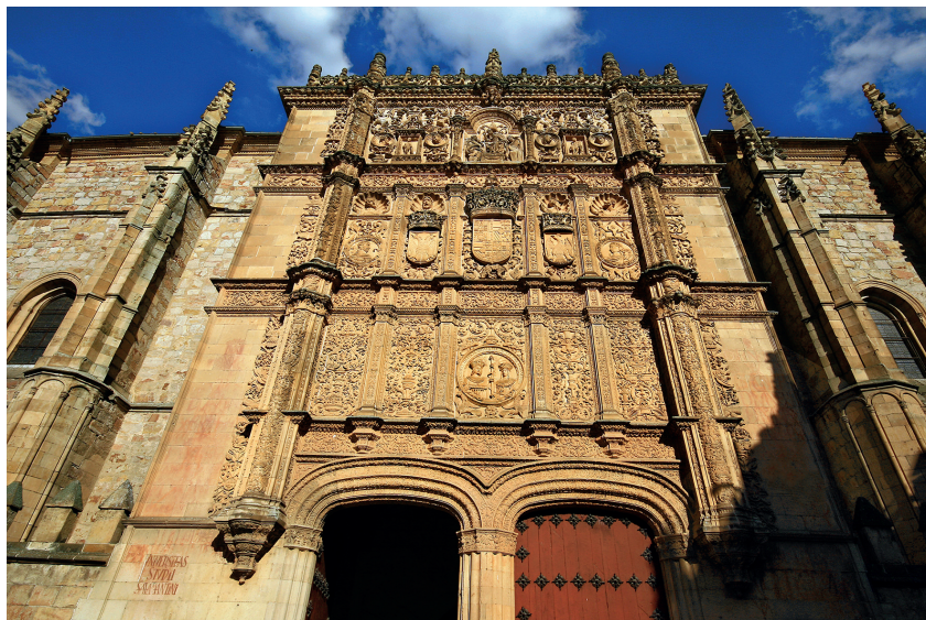
Imagen 1. Fachada de las Escuelas Mayores de la Universidad de Salamanca. Finalizada en 1528.

A la vez, los reyes requieren profesores de la Universidad como expertos en ciertas áreas estratégicas. Algunos ejemplos que lo corroboran: en 1494 recurrieron a maestros en Astrología y Cosmología para discutir «sobre algunas cosas de la mar», pues Salamanca y su Universidad tuvieron un papel importante en la empresa americana 5 . Asimismo, los cargos de gobierno y de administración de justicia fueron reclutados tradicionalmente entre el personal académico, desde tiempo de los Reyes Católicos 6 .