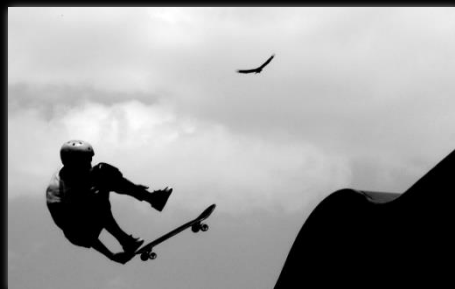
Skatista Skater Autor: Renan William Candido