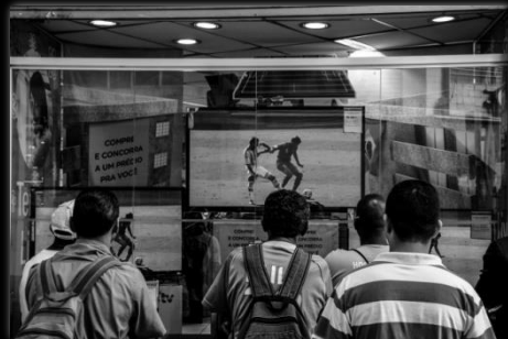
Fútbol. Una religión Futebol. Uma religião Autor: Renan William Candido