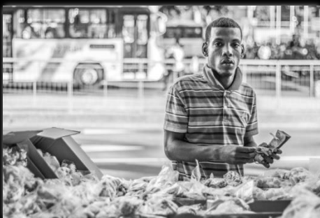
Nuestro pan Pão nosso Autor: Camila Guimarães