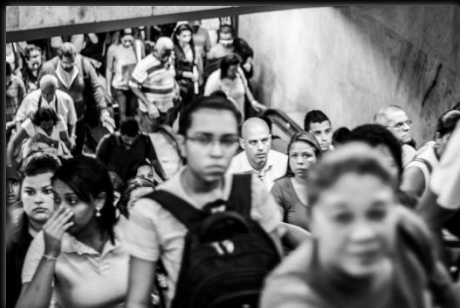
Hora de cerrar Fim do expediente Autor: Camila Guimarães