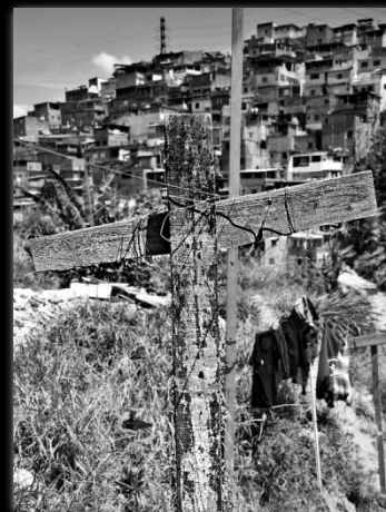
La cruz de la favela A cruz da favela Autor: Marcio Salata