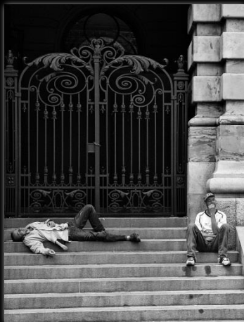
Mundos distantes Mundos distantes Autor: Marcio Salata