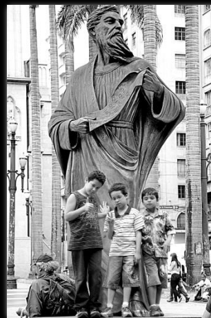
Futuro Futuro Autor: Marcio Salata