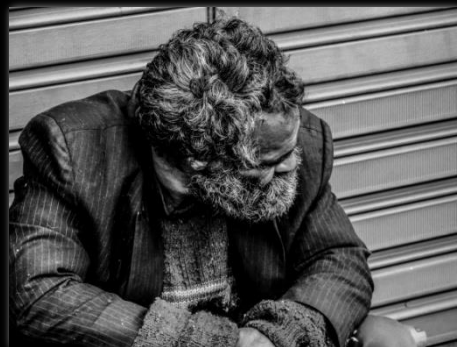
Favela del Molino. Mendigo en la región central de São Paulo. Favela do Moinho. Mendigo na região central de São Paulo. Autor: Renan William Candido