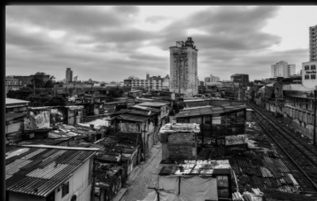
Favela del Molino Favela do Moinho Autor: Renan William Candido