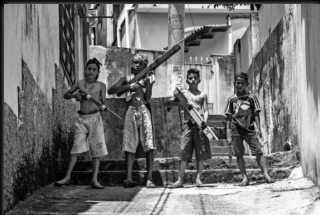
Polícia y ladrón Polícia e ladrão Autor: Marcio Salata