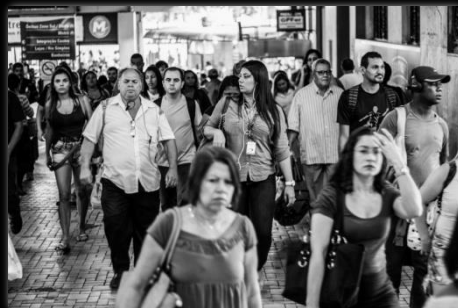
Mar de gente Mar de gente Autor: Camila Guimarães