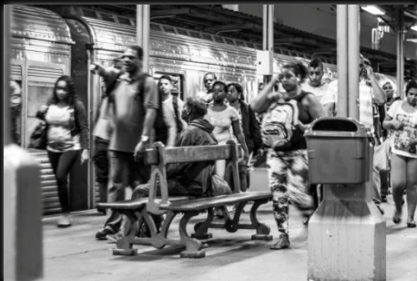
Marcha Marcha Autor: Camila Guimarães