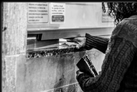
Compruebe el cambio Confira o troco Autor: Camila Guimarães