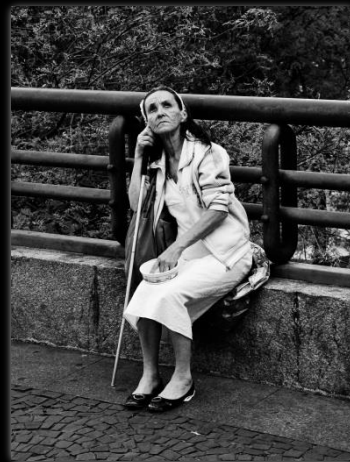
Ojos del alma Olhos da alma Autor: Marcio Salata