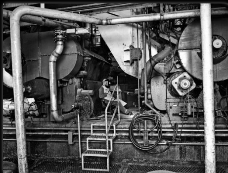
Engranando el progreso Engrenando o progresso Autor: Marcio Salata