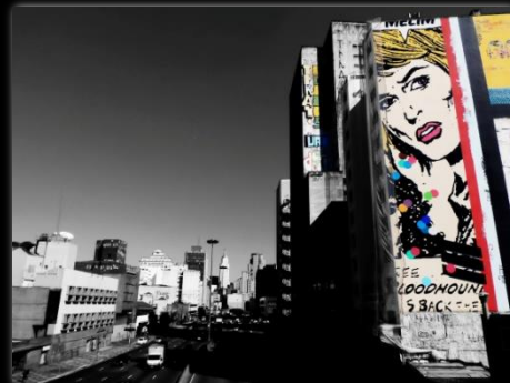
Vista del pasadizo de la Calle de las Novias Vista da passarela da Rua das Noivas Autor: Renan William Candido