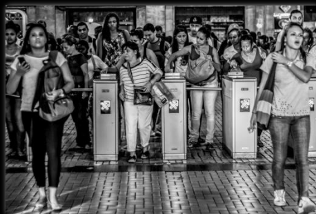
Guerreras Guerreiras Autor: Camila Guimarães