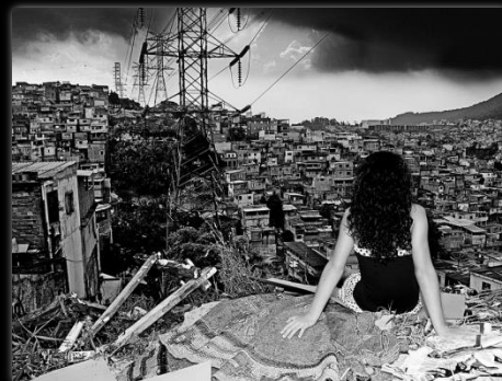
Abriendo los ojos Abrindo os olhos Autor: Marcio Salata