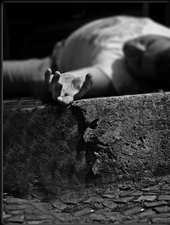
En la cuneta Na sarjeta Autor: Marcio Salata