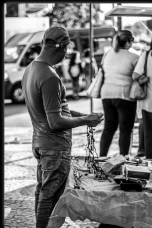
Flagrante Flagrante Autor: Camila Guimarães