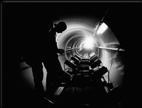
La luz al final del túnel A luz no fim do túnel Autor: Marcio Salata