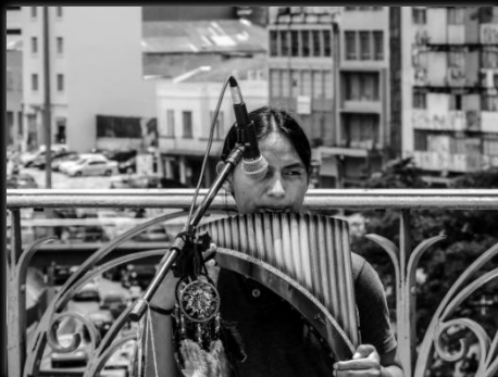
Hombre tocando la Flauta Andina Homem tocando a Flauta dos Andes Autor: Renan William Candido