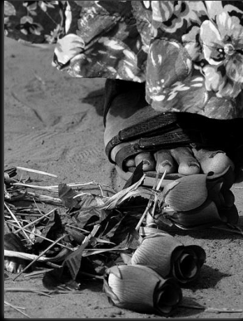
Rosa del morro Rosa do morro Autor: Marcio Salata