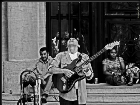
Guitarrista en éxtasis Guitarrista em êxtase Autor: Renan William Candido