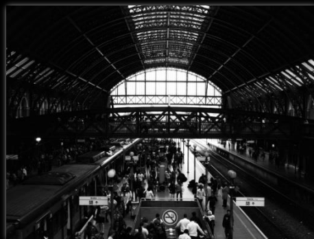
Interior de la Estación de la Luz Interior da Estação da Luz Autor: Renan William Candido