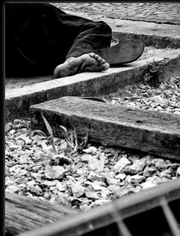
Entumecido de piedra Entorpecido de pedra Autor: Marcio Salata