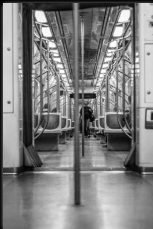
Comenzar de nuevo Recomeçar Autor: Camila Guimarães