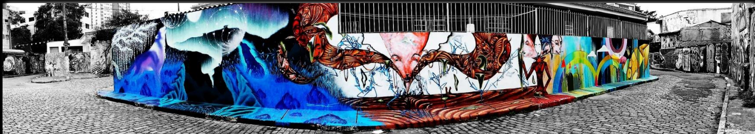
Callejón de Batman Beco do Batman Autor: Renan William Candido