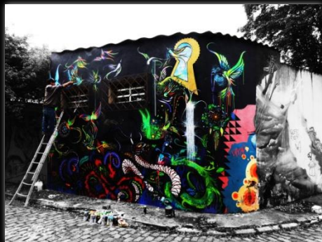
Callejón de Batman Beco do Batman Autor: Renan William Candido