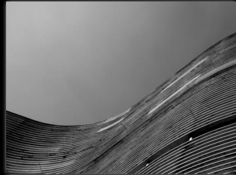
Detalle del Edificio Copan Detalhe do Edificio Copan Autor: Renan William Candido