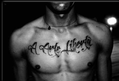
¿Liberta? Liberta? Autor: Marcio Salata