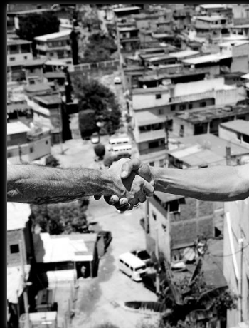
De los acuerdos necesarios Dos acordos necessários Autor: Marcio Salata