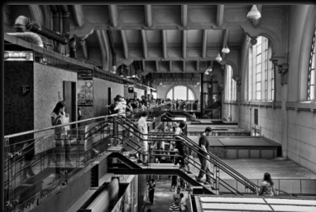
Mercado Municipal Mercado Municipal