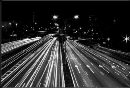
Avenida 23 de Mayo Avenida 23 de Maio Autor: Renan William Candido