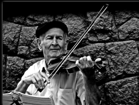
Joven Espíritu violinista Jovem Espíritu violinista Autor: Renan William Candido