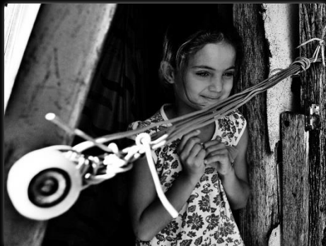
Escondidos en la periferia Escondidos na periferia Autor: Marcio Salata