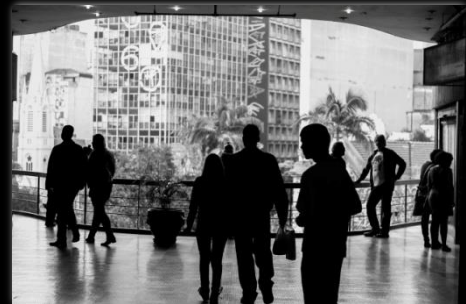
Galería del Rock Galeria do Rock Autor: Renan William Candido