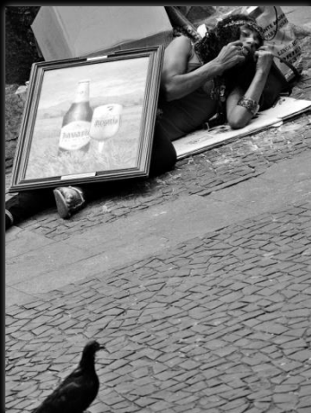
Calentando la piel Aquecendo a pele Autor: Marcio Salata