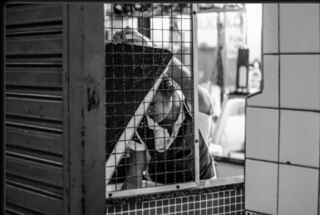
Pagar antes de ordenar Pague antes de pedir Autor: Camila Guimarães