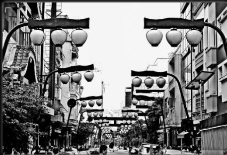
Barrio la Libertad Bairro a Liberdade Autor: Renan William Candido