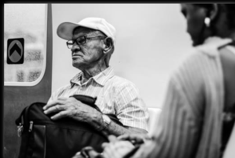
Historia História Autor: Camila Guimarães