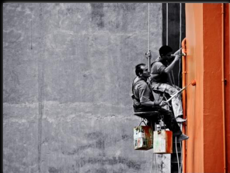
Hombres trabajando Homens trabalhando Autor: Renan William Candido