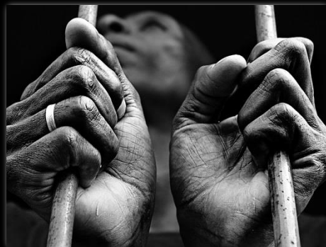
Rehén del hogar Refém do lar Autor: Marcio Salata