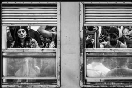
Dos clics Dois cliques Autor: Camila Guimarães