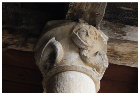
Fig. 5. Capitel. Patio de la Cisterna. Monasterio de Santa Sofía de Toro, Zamora. Fotografía de la autora, octubre de 2021.