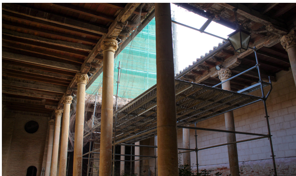
Fig. 4. Patio de la Cisterna. Monasterio de Santa Sofía de Toro, Zamora. Fotografía de la autora, octubre de 2021.