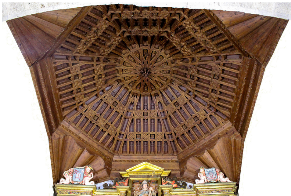
Fig. 10. Armadura de la capilla mayor de la iglesia. Monasterio de Santa Sofía de Toro, Zamora. Fotografía de la autora, octubre de 2021.