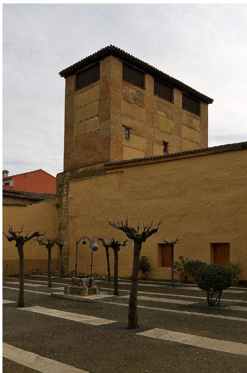
Fig. 1. Vista al torreón desde el patio central. Fotografía de José Luis Filpo Cabana, noviembre de 2014. Licencia Creative Commons Attribution 3.0 Unported. Disponible: https://commons.wikimedia.org/wiki/File:Monasterio_de_Santa_Sof%C3%ADa,_Toro._Torre%C3%B3n.jpg [19/10/2021].

En consecuencia, y coincidiendo con el año en que las sofías celebran el novecientos aniversario de la fundación de la Cándida y Canónica Orden Premonstratense, se plantea aquí un relato del desarrollo historiográfico seguido por la crítica académica que ha tratado, durante los últimos años, alguna de las muchas aristas que conforman la realidad bajomedieval del Monasterio premostratense de Santa Sofía.