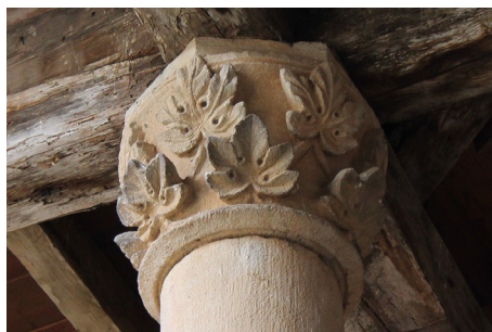
Fig. 8. Capitel. Patio de la Cisterna. Monasterio de Santa Sofía de Toro, Zamora. Fotografía de la autora, octubre de 2021.