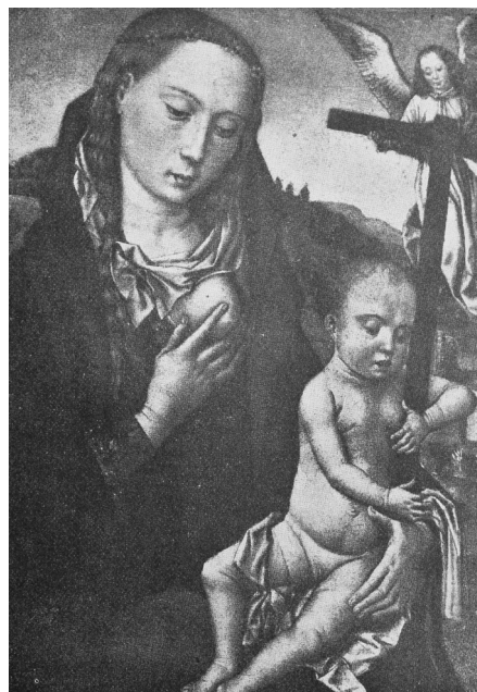
Fig. 3. Tabla flamenco de Virgen con Niño. Antiguamente propiedad del Monasterio de Santa Sofía, hoy en colección privada.