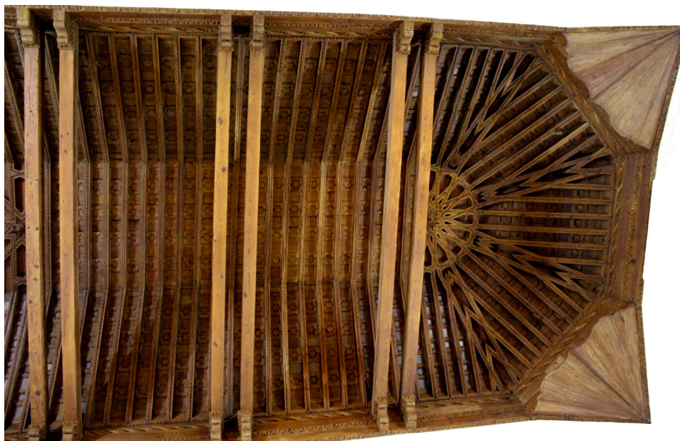
Fig. 9. Armadura de la nave de la iglesia. Monasterio de Santa Sofía de Toro, Zamora. Fotografía de la autora, octubre de 2021.