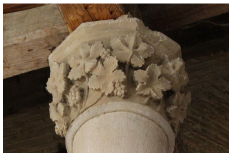
Fig. 7. Capitel. Patio de la Cisterna. Monasterio de Santa Sofía de Toro, Zamora. Fotografía de la autora, octubre de 2021.