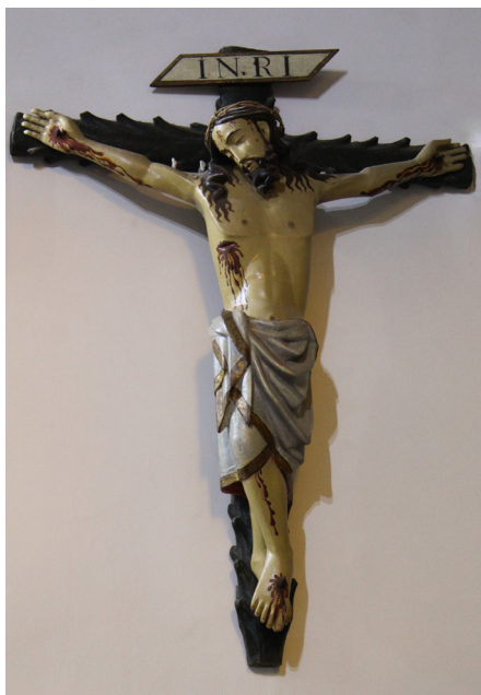
Fig. 2. Crucificado gótico. Nave del evangelio de la capilla mayor. Iglesia del Monasterio de Santa Sofía, Toro, Zamora. Fotografía de la autora, octubre de 2021.