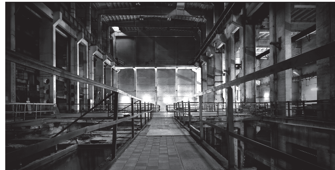
Interior de Tresor Berlín

Las fiestas en naves industriales se remontan a finales de los setenta, al reggae, al blues, a los bares sin licencia y a los garitos ilegales para beber que abrían de madrugada, cuando todo cerraba. En los ochenta el fenómeno se extendió desde fiestas funk, soul y hip hop (...) en naves industriales de los ferrocarriles británicos y en colegios en ruinas. The mutoid Waste Company era un colectivo de gente anarcopunk que vivía en caravanas y hacía esculturas postapocalípticas con chatarra y basura. (...) La obsesión por el acid house provocó un estallido de fiestas en naves industriales puesto que los ravers querían burlar las restrictivas horas de apertura de los clubs con licencia (...) “Cortabas los candados con tenazas y echabas la puerta abajo de una patada, de día” recuerda Mr C de esas fiestas puntuales estilo okupa. (Reynolds, S, 2014, p.104)