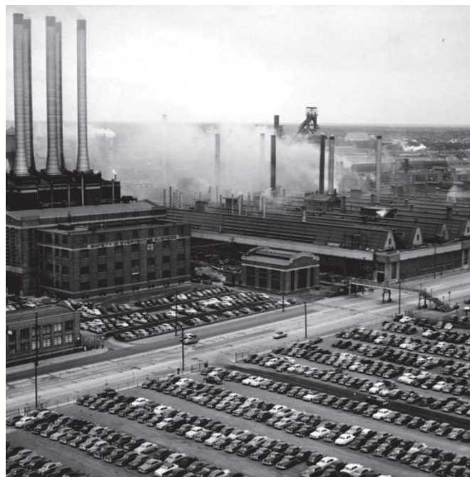
Factoría en Detroit