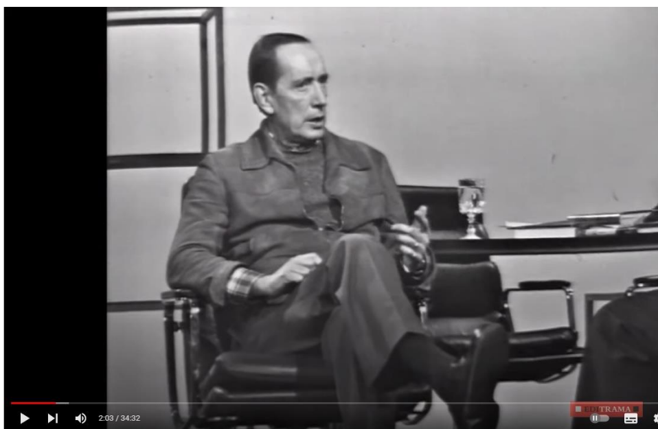
MIGUEL DELIBES A FONDO - EDICIÓN COMPLETA y RESTAURADA

Para ello, se ha profundizado en los motivos de la escritura de Delibes presentes a partir de entrevistas y documentales sobre Miguel Delibes; de artículos académicos en Google scholar; y de un seminario impartido por el director de la Fundación Miguel Delibes.