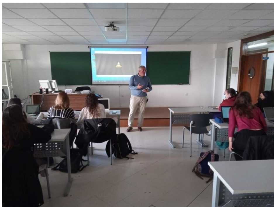
Fotografía del seminario impartido por el director de la Fundación Miguel Delibes

Bibliografía consultada por uno de los grupos