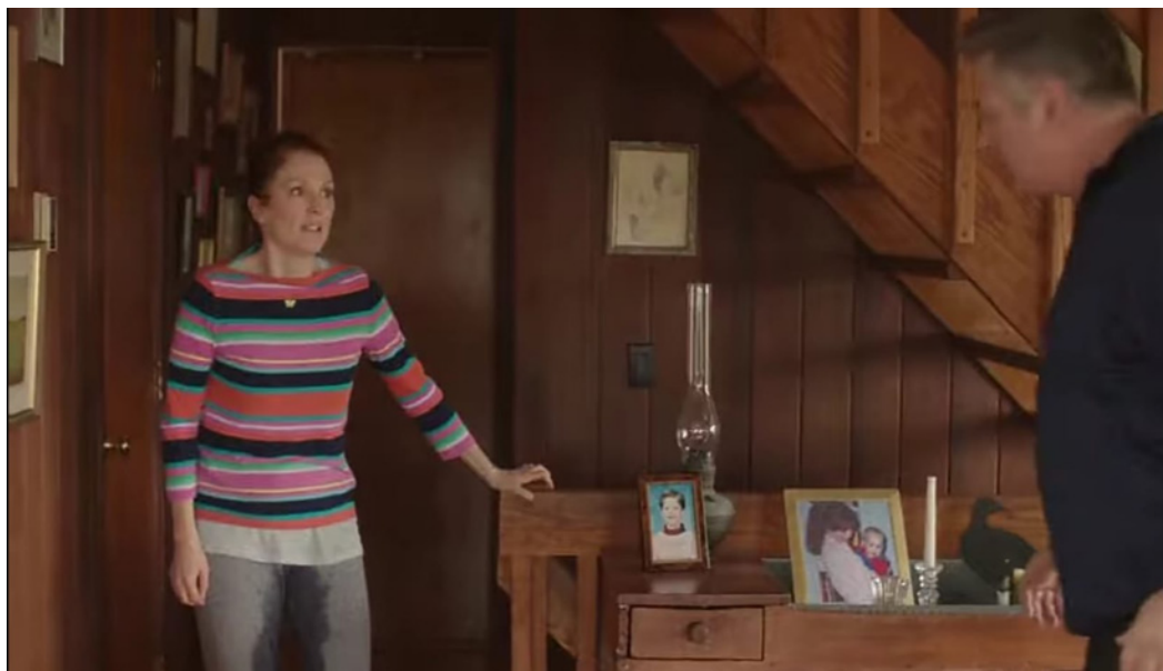
Fotograma 6. No logra identificar dónde se encuentra el baño. Todavía existe apoyo de su esposo