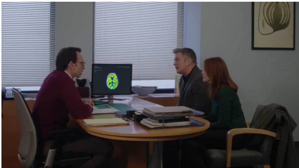
Fotograma 3. Segunda consulta con el neurólogo acompañada de su esposa: le diagnostican Alzheimer

LUIS MANCO-TELLO; RAUL EDUARDO ESPINOZA-LECCA; HANS CONTRERAS-PULACHE