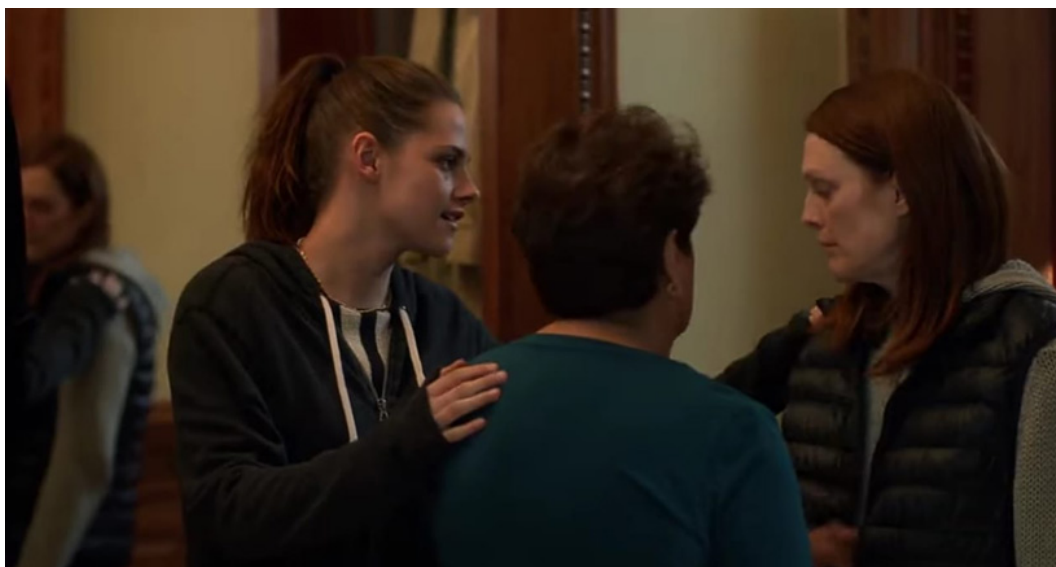
Fotograma 8. No reconoce a la gente de su alrededor, y queda al cuidado de su hija menor