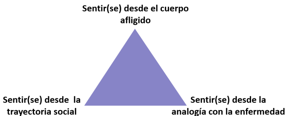
Ilustración 1. Propuesta interpretativa de la experiencia previa

Para desarrollar la propuesta de interpretación del sentido de los datos relativos a la experiencia posterior a la participación en el movimiento social utilizamos el mismo esquema y seguimos con un abordaje dialéctico. Triangulamos los tres "vértices" (categorías o códigos) de la experiencia previa con la experiencia posterior, tal y como recoge la ilustración 2, ajustando las dinámicas participativas en Stop