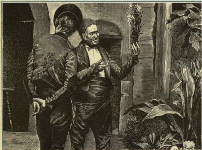
—Pues con esta mata de marihuana me he ahorrado el tomarme tres litros de cognac.