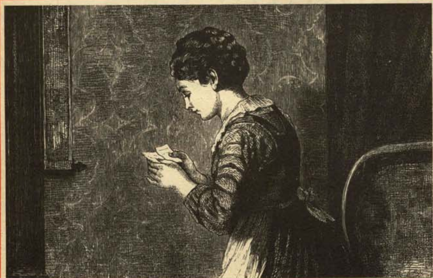
—¡Qué bien! Una carta de amor de doce resultados.