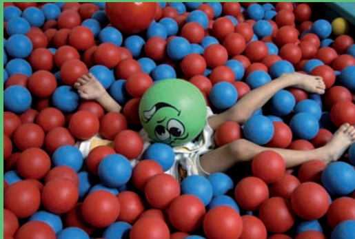
Mis Piernas. Autor: Randy Rodríguez Pagés V Concurso de Fotografía Digital del INICO

el ámbito. Además, cada una de las áreas está coordinada y supervisada por un profesor, también especialista, encargado de planificar, dirigir y coordinar el rico y diverso quehacer académico, en el que adquiere una gran importancia la dedicación, trabajo y la participación activa de los alumnos en las actividades propuestas. Esta dinámica, como avala la experiencia de años anteriores, conduce a una formación de calidad orientada hacia el conocimiento y mejora de las condiciones de vida de las personas con discapacidad.