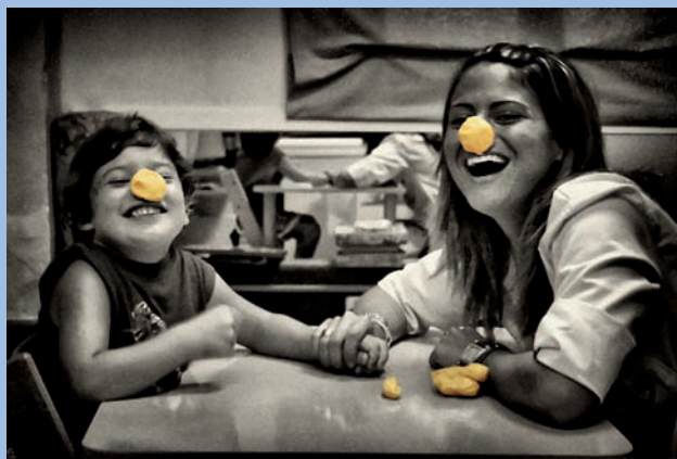
La Sonrisa, su mejor terapia. VII Concurso de Fotografía Digital del INICO