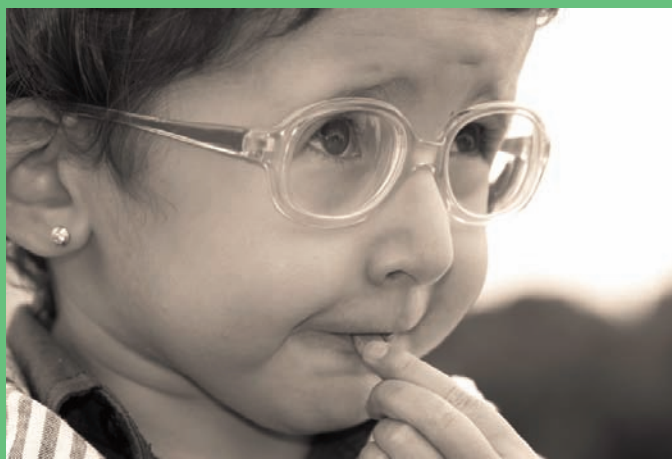
La Mirada de la Esperanza. Autor: Pedro Pulido Finalista Concurso 2010

Un año más contamos con la colaboración de la Fundación Grupo Norte para la realización del Concurso y la financiación de los premios en metálico.