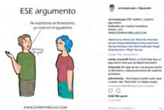
Figura 9. Publicación de Zorras y Brujas

En la misma línea, las ilustradoras de Zorras y Brujas también critican en la siguiente ilustración la confusión con el término feminista y, cómo ha menudo se confunde con lo opuesto al machismo.