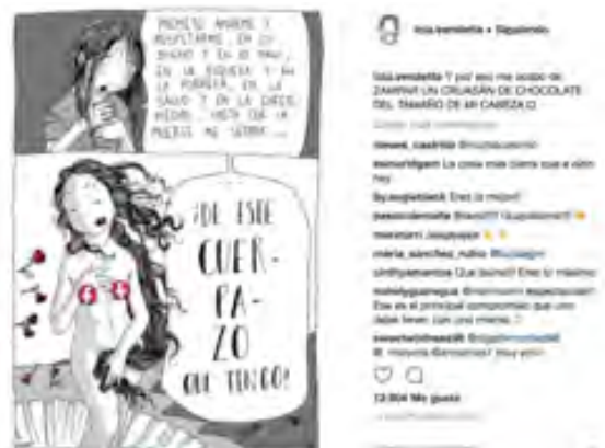
Figura 10. Publicación de Lola Vendetta

Junto con este tipo de reivindicaciones, las ilustraciones de estas artistas feministas, a menudo, se centran visibilizar a la mujer real; denunciando el ideal de belleza que tradicionalmente han potenciado la publicidad y los medios de comunicación (mujer joven, eternamente bella y con cuerpo escultórico). Frente a esa imagen idealizada de mujer, ilustradoras como Lola Vendetta publican obras en las que muestran que todos los cuerpos posibles pueden ser bellos.