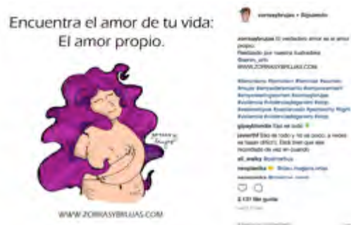
Figura 11. Publicación de Zorras y Brujas