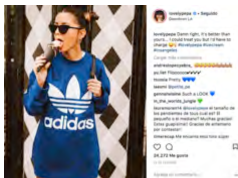
Figura 6. Publicación de Lovely Pepa

Es el caso, por ejemplo, de esta imagen de una de las instagramer de moda con más influencia y seguidores, Lovely Pepa en la que aparece comiendo un helado con una camiseta de marca; una acción con la que logra más de 24.000 “me gusta” y múltiples comentarios. Es decir, un elevado nivel de engagement .