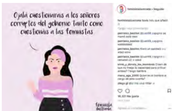
Figura 8. Publicación de Feminista ilustrada