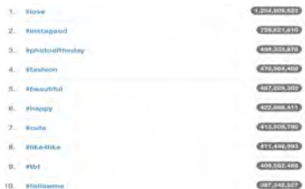
Figura 4. Ranking de palabras más exitosas en Instagram

Aunque la diferencia de seguidores entre ambas influencers es muy elevada (2.313.321), la influencia de Lola Vendetta en Instagram es muy alta, sobre todo considerando cuáles son las temáticas que más triunfan en esta red social. Según Websta, una herramienta gratuita de análisis y estadísticas para Instagram, las 5 temáticas más destacadas y que cuentan con más presencia en esta red social son las siguientes: love , instagood , photooftheday , fashion , beautiful . Así consta en la siguiente captura de imagen de los resultados ofrecidos por Websta. Según esta herramienta la palabra feminismo, y otras palabras asociadas como género, igualdad de género, sexismo, etc. no se encuentran entre las 100 palabras más utilizadas en esta red social.