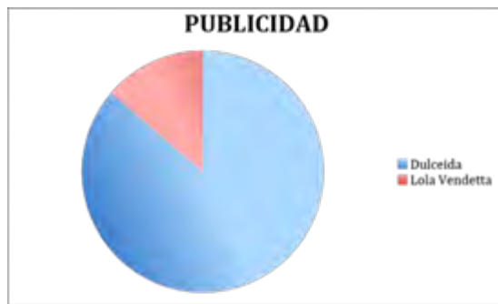
Figura 5. Comparativa de presencia publicitaria.

No obstante, en el caso de las publicaciones que realizan las artistas ilustradoras, hay un 15% de presencia publicitaria, pero se trata de productos relacionados con su propia actividad feminista (libros vinculados a su actividad, cursos, charlas...), no de otras marcas.