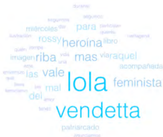
Figura 12. Hashtag más utilizados por Lola Vendetta

Los contenidos de corte feminista y de reivindicación de género también se ven reflejados en el tipo de hashtag que utilizan con más frecuencia. Así consta en la siguiente imagen (extraída de una análisis hecho con la herramienta Keyhole ), correspondiente a las palabras clave que más ha utilizado Lola Vendetta en los últimos meses en sus publicaciones; entre ellas, destacan “feminista”, “patriarcado” y “feminismo”.