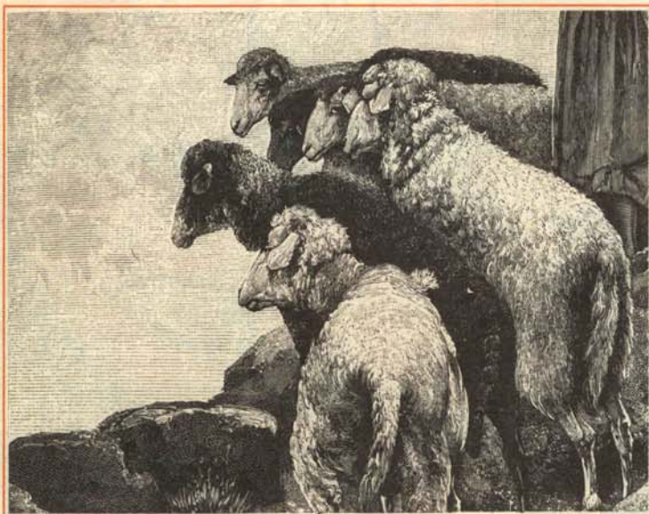
—¡Pues tampoco son para tanto las democracias!