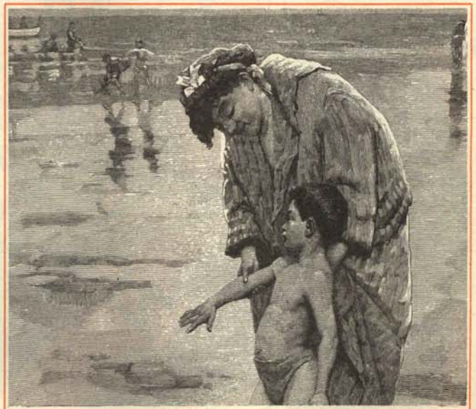
—Anda, no tengas miedo, que ya le han puesto cloro.