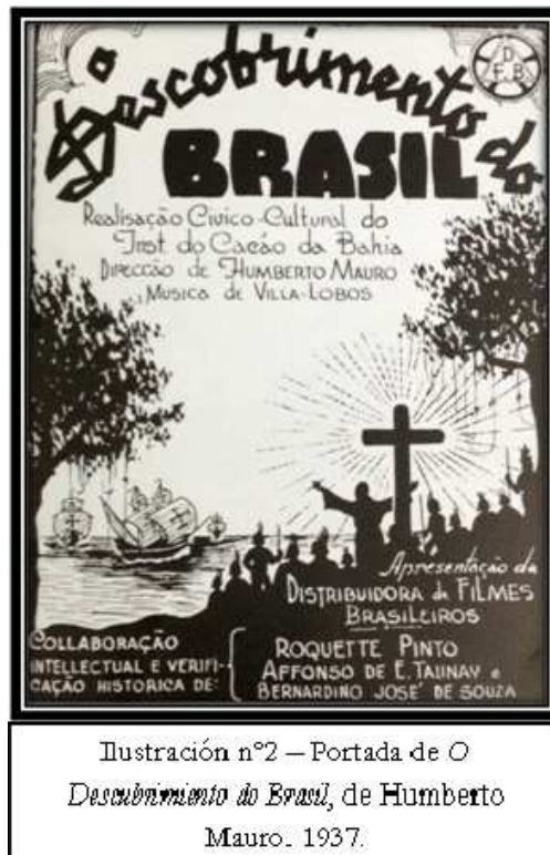
Ilustración nº2 – Portada de O Descobrimiento do Brasil , de Humberto Mauro. 1937.

Las razones de esas ausencias incluyen, obviamente, los aspectos demográficos de Brasil: los pueblos indígenas son una minoría si se compara con la población brasileña mestiza, de origen europeo o africano. Pero eso no es todo, la fuerte ausencia indígena en la realización y en los temas de la industria cinematográfica brasileña es ejemplo del desinterés, del olvido y de la negación que sufren los pueblos indígenas brasileños. La película de Sylvio Back que se va a analizar a continuación es una recopilación que abarca mucho del material producido durante el primer siglo de cine en Brasil, con respecto a los pueblos indígenas.