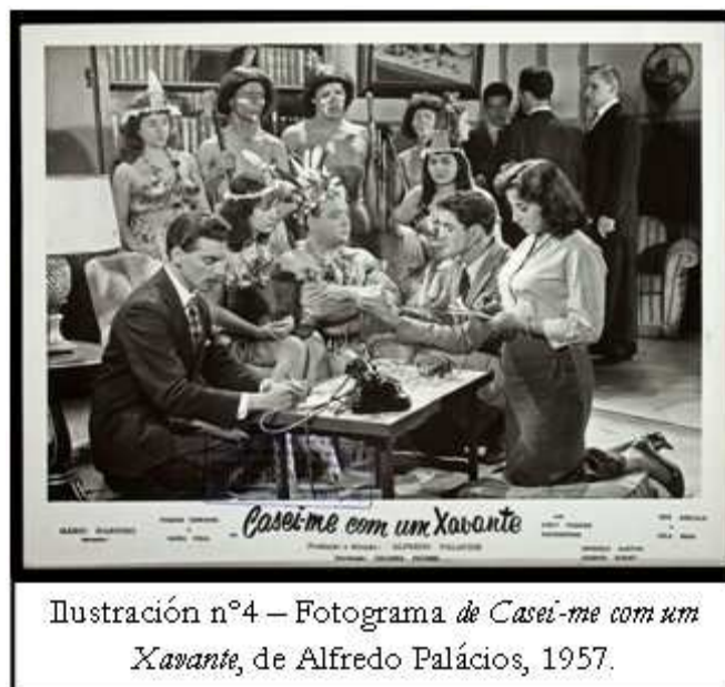
Ilustración nº4 – Fotograma de Casei-me com um Xavante , de Alfredo Palácios, 1957.

Una serie de otras secuencias componen aún el Yndio frankenstein de Sylvio Back. Pero el director termina su película con una visión optimista en dirección al futuro de la representación indígena en el cine brasileño: la última secuencia se nos muestra niños indígenas, sus hábitos, juegos y alegría. Mientras, una narración declama un poema de rebeldía contra todo y todos ( sertanistas , políticos, padres, ecólogos, antropólogos, indianistas, cineastas e indios incluidos). Se trata de la película Ikaténa (Vamos Caçar?) (Luiz Paulino dos Santos, 1983), ligado a las obras de los “medios de comunicación indígena”, donde se retrata la iniciación de los niños zorós en el arte de la caza 54 . Tal vez, al final, solo la misma auto-representación sea la salida.