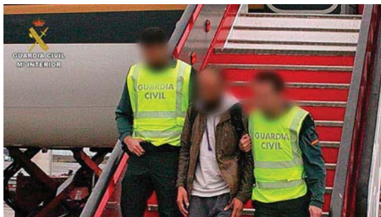
Figura 1. Ciudadano español detenido el pasado mes de noviembre cuando se disponía a viajar a Siria (Fuente: RTVE).

otros rasgos que lo distinguen de lo establecido en épocas pasadas. Mientras que en otros conflictos la movilización era –prácticamente– limitada a países del entorno o en los que predomina la religión musulmana, en la actualidad muchos Foreign Terrorist Fighters (FTF) (nombre con el que ha sido rebautizado el fenómeno por su marcado carácter terrorista) proceden de estados occidentales. Entre estos se encuentran diversos países de la Unión Europea, entre los que cabe destacar a Francia, Alemania o Reino Unido.