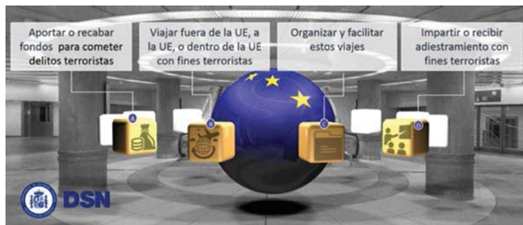
Figura 2. Esquema de la nueva normativa realizado por el Departamento de Seguridad Nacional.

en las plazas de Siria e Irak resulta cada vez más evidente, hecho que favorecerá durante los próximos meses el intento de regresar a su país de partida de un significativo número de desplazados. Aunque la amenaza para España (integrada en el espacio Schengen) no procede únicamente de los desplazados desde su territorio cabe señalar que, de acuerdo a las últimas cifras publicadas, se han identificado a 208 españoles o extranjeros residentes en España que han viajado a Siria o Irak, entre los cuales hay 46 muertes confirmadas y 32 han regresado a Europa. ■