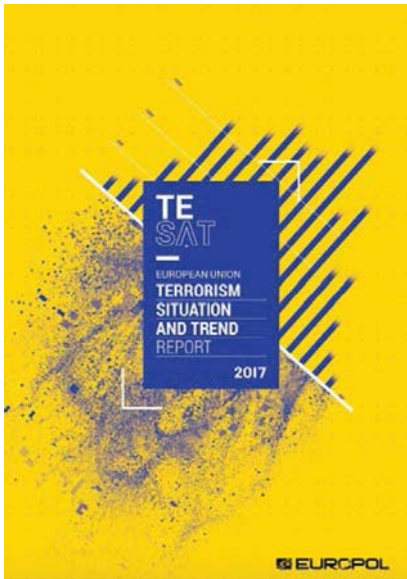
Imagen 1. Portada TE-SAT 2017.

ataques, entre fallidos, frustrados y ejecutados de forma efectiva. Estos ataques fueron reportados por ocho estados: Reino Unido (76), Francia (23), Italia (17), España (10), Grecia (6), Alemania (5), Bélgica (4) y Países Bajos (1). El número de ataques que se ejecutaron es de 47 (aproximadamente un 33,1%). El número total de ataques es inferior al de años precedentes, siendo de 193 en el año 2015 y 226 en el año 2014. Por lo que, a tenor de los citados datos, resulta posible hablar de una tendencia descendente en la cifra de ataques terroristas en territorio de la UE. En relación al armamento empleado en los ataques, destaca que en el 40% estaba constituido por artefactos explosivos. Destaca que, tan solo, en seis actos fueron empleadas armas de fuego, frente a 57 en el año 2015. El número total de vícti-