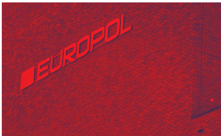
Imagen 2.

El terrorismo yihadista representa una gran amenaza para las sociedades europeas que –en los últimos meses– se han visto muy perturbadas por diversas acciones de este tipo de terrorismo.