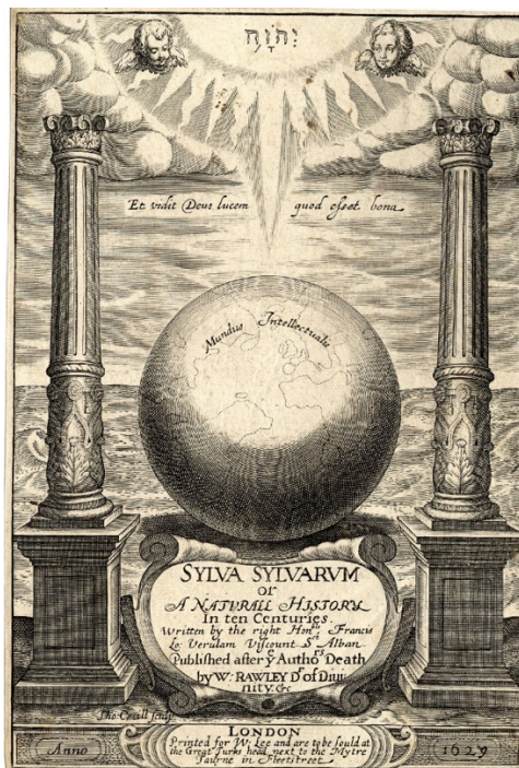
Portada de la obra Sylv Sylvarum de Francis Bacon.