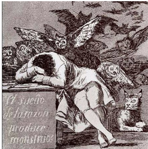
Capricho N° 48, Francisco de Goya.