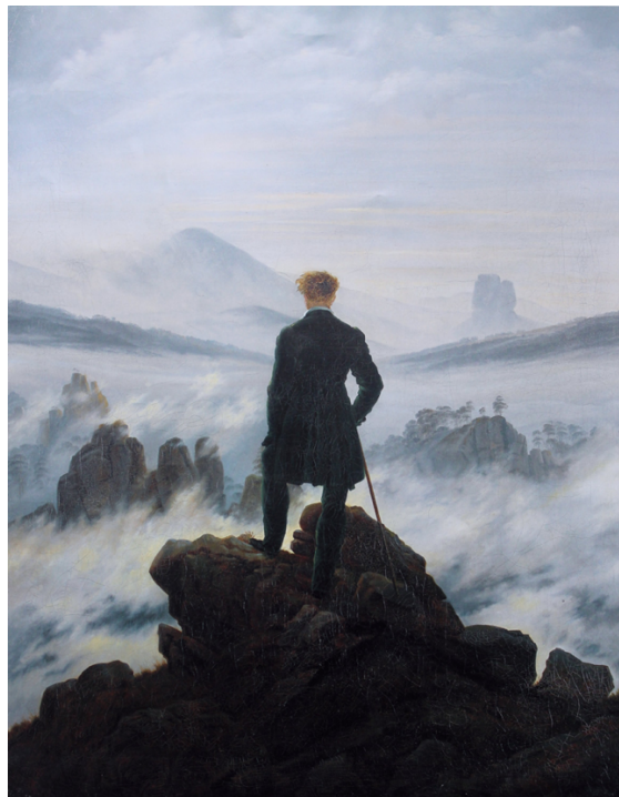
El caminante sobre el mar de nubes, Caspar Friedrich.