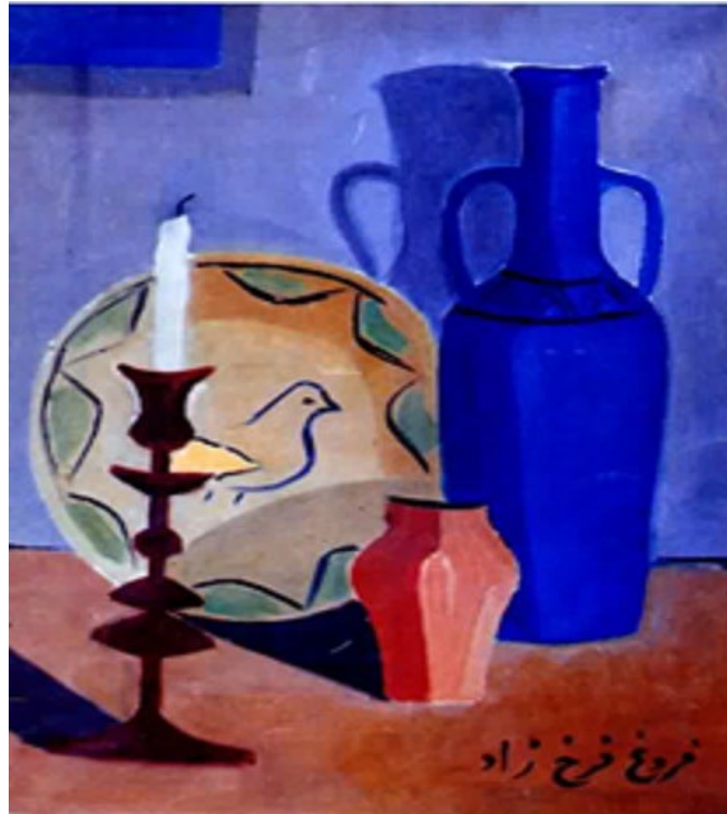
Uno de los cuadros de Foruq