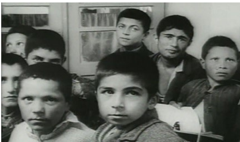
Una escena de La casa es negra

El mismo año viajó a Tabriz, una ciudad situada al noroeste de Irán. Allí dirigió un breve documental La casa es negra , sobre la leprosería de esta ciudad. El documental es una obra de arte que mezcla la imagen y la poesía. En esta obra magistral escuchamos la propia voz de Foruq recitando algunos de sus poemas acompañado con unas imágenes de los enfermos y su entorno.