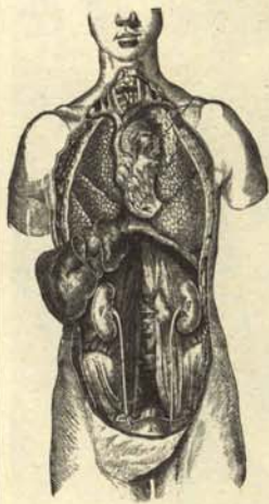
VIAJERO SIN DROGA

Ofrecemos en exclusiva nacional un documento gráfico de tan necesarias, aunque severas medidas.