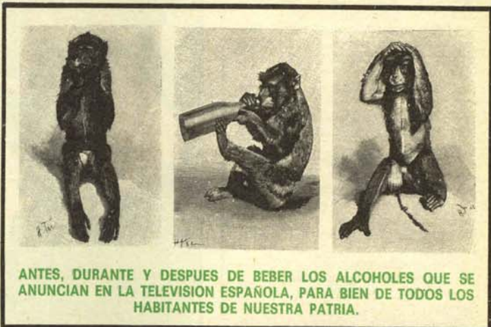
ANTES, DURANTE Y DESPUES DE BEBER LOS ALCOHOLES QUE SE ANUNCIAN EN LA TELEVISION ESPAÑOLA, PARA BIEN DE TODOS LOS HABITANTES DE NUESTRA PATRIA.