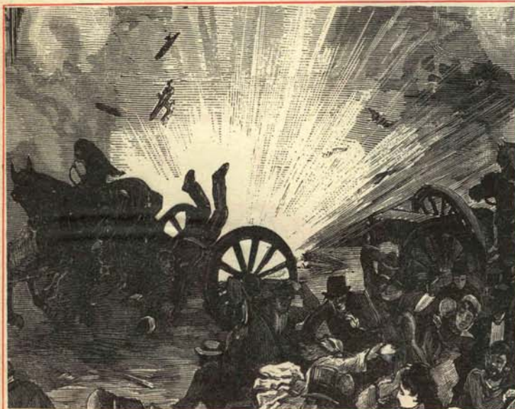
No asustarse, que es sólo una efemérides histórica.