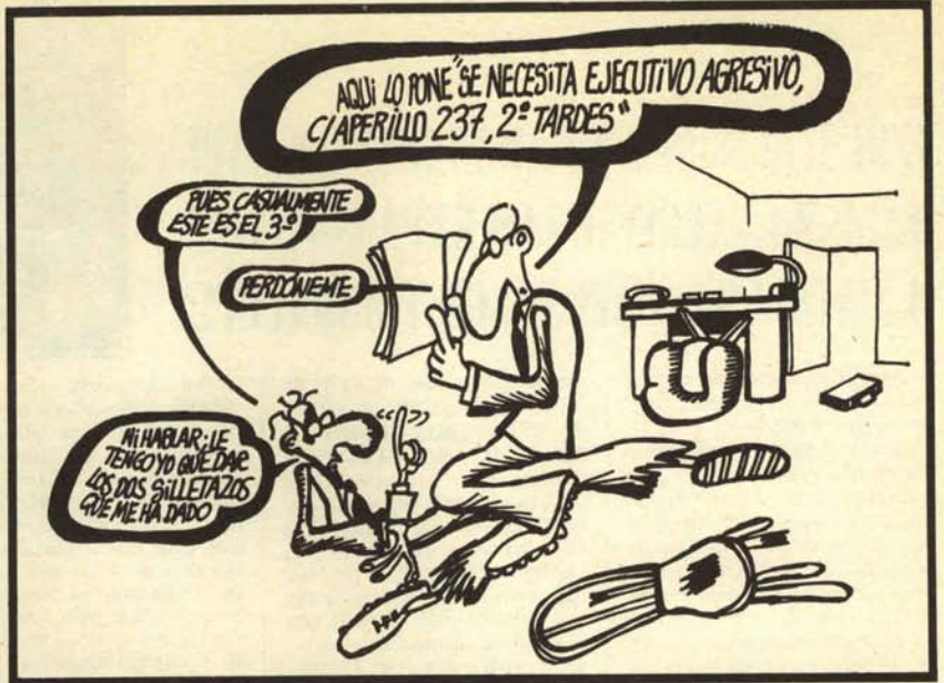
Al señor director general