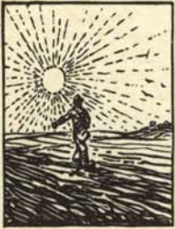
«¿Es este tu deporte?».