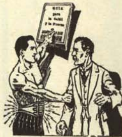
«Un libro ayuda a triunfar».