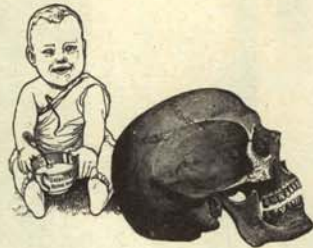
«¿Por qué no viniste en tren, papaito?».