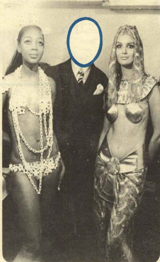
Modelo «Rodríguez de ciudad» (para cabezas gordas).