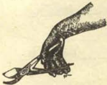
b) Posición para censurar películas.