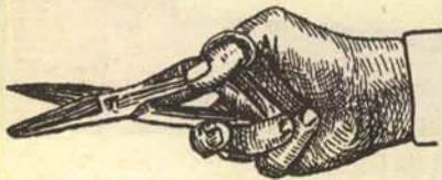
a) Posición para censurar libros.

Es muy fácil. Se compran unos alicates de censurar, como los aquí presentes, y se destruye lo que más le moleste con las siguientes posiciones: