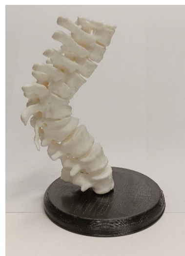
Figura 5. Modelo impresión 3D Columna Dorso-lumbar.