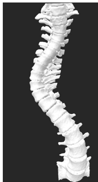
Figura 2. Procesamiento de curva escoliotica.