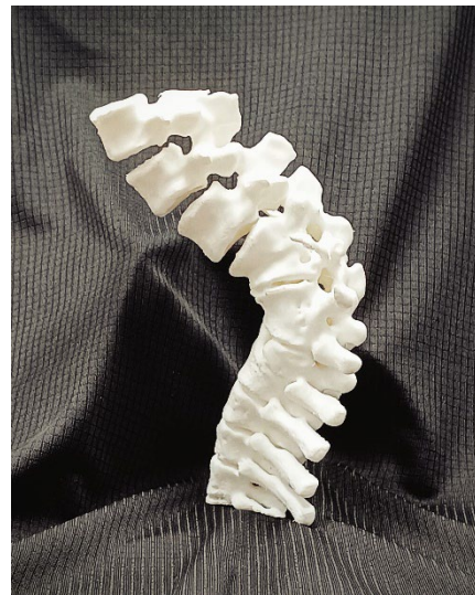
Figura 3. Impresión a tamaño reducido de curvatura dorso-lumbar (modelos colocados boca abajo en la imagen)..