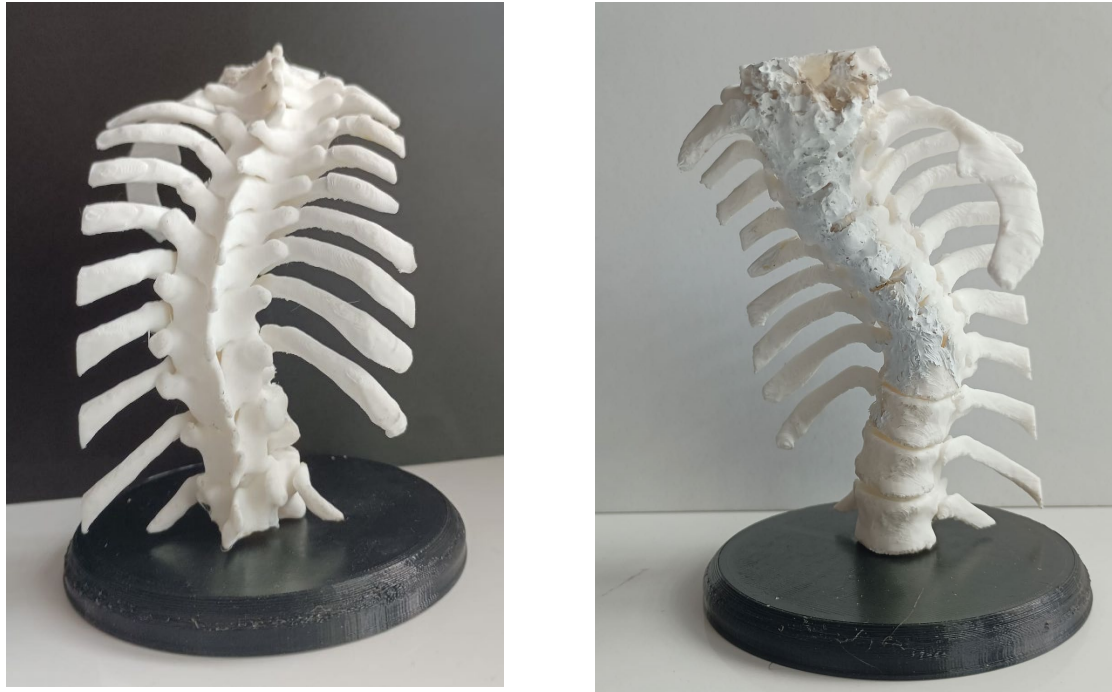
Figura 6. Modelo impresión 3D Columna Dorsal.