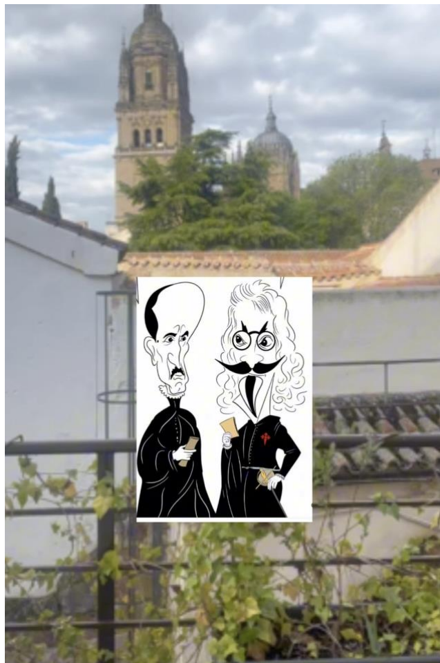
Fig. 6. Captura de pantalla de booktrailer usando secuencias de vídeo de producción propia en formato vertical (pensado para redes sociales de consumo en el móvil).