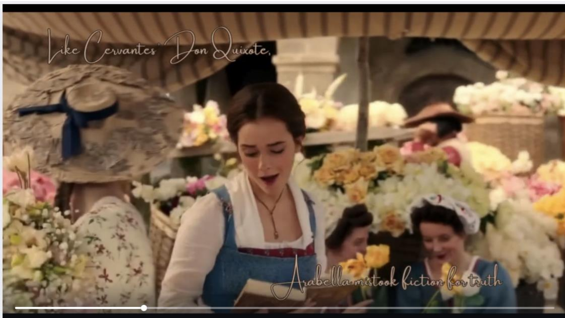
Fig. 4. Captura de pantalla de booktrailer usando la integración de fuentes externas (vídeos ajenos, sacados de películas u otras fuentes). Realizado con Canva.