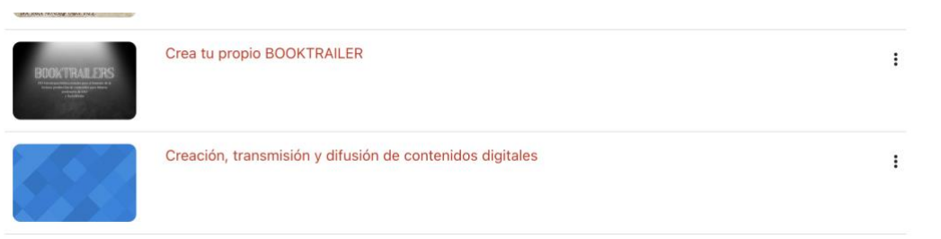
Fig. 1. Oferta formativa especializada en booktrailer en Studium ofrecida a los estudiantes.

El grupo que tenía acceso al proceso formativo contó con materiales diseñados específicamente para ellos por miembros del equipo, que se complementaban con las correspondientes encuestas, actividades, etc.