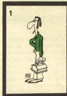
Calceolustrans genuflexus meridionalis.

trans genuflexus meridionalis). Su hábitat coincide sensiblemente con el del ignifer tabernensis, con el que a veces se cruza, originando un híbrido estéril. El plumaje del calceolustrans es vario, pero predominan el negro y azul marino con toques de la-tón. Es fácilmente reconoci-