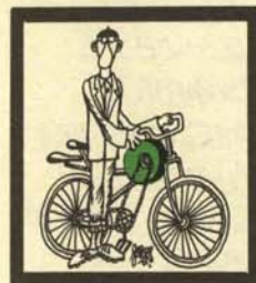
AFILADOR ( Monorotatus sibilans Gallecliorum)

Especie nómada, es fácil distinguirlo por su silbido característico y, ópticamente, por el chorro de chispas que suele producir. Tiene sus criaderos en Lugo, principalmente, y desde allí se expande por todo el territorio peninsular arrullando con sus silbos en escala las siestas de los españoles. Su excepcional ubicuidad le hace difícil de situar en lugares determinados, aparte de las citadas zonas gallegas, donde desova; sin embargo, el aficionado puede hallarlo con relativa frecuencia cerca de las carnicerías.