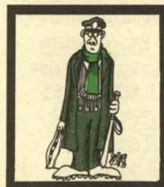
SERENO ( Clavarius noctivagus municipalis)

Especie nómada, es fácil distinguirlo por su silbido característico y, ópticamente, por el chorro de chispas que suele producir. Tiene sus criaderos en Lugo, principalmente, y desde allí se expande por todo el territorio peninsular arrullando con sus silbos en escala las siestas de los españoles. Su excepcional ubicuidad le hace difícil de situar en lugares determinados, aparte de las citadas zonas gallegas, donde desova; sin embargo, el aficionado puede hallarlo con relativa frecuencia cerca de las carnicerías.