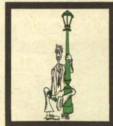
CURDA NOCTURNO ( Curda canens nocturnalis)

Especie nocturna, habita en zonas perfectamente delimitadas y que defienden de sus congéneres intrusos. Como el «portaaperiensi mutilatus» es obolófago con gran avidez y su plumaje suele consistir en un guardapolvo gris, gorra de plato con escudo y la característica clava, vulgarmente chuzo, que le da nombre, aunque hay autores que, erróneamente, afirman procede «clavarius» del verbo clavar. Su caza es tan sencilla que carece de emoción: basta batir palmas para que, casi superponiéndose al eco de las palmadas, se oigan los golpes característicos de la clava en las aceras. Su capacidad vital de asociación es grande, por lo que se relaciona con especies distantes como el «ignifer», «vulpes fornicatrix», «curda canens», etcétera.