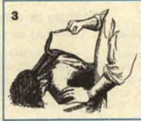
3 Extracción del gusanillo causante de los males dichos.