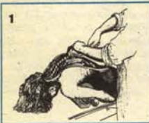
1 Posible futuro alcohólico.

El consumo de alcoholes fuertes bebidos en ayunas para matar el gusanillo venía causando estragos en la salud pública nacional. Gracias a los avances de la Medicina moderna, desde ahora el gusanillo podrá ser extraído quirúrgicamente de una vez para siempre: