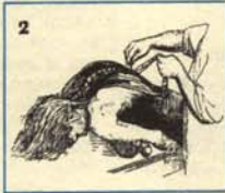
2 Localización del gusanillo.