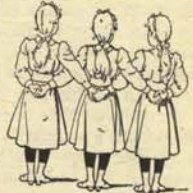
2.—La misma asociación vista por detrás.