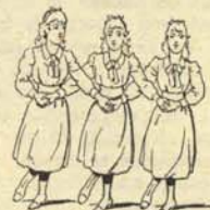
3.—La asociación política en plena campaña electoral.

tándose miméticamente: de la vistosa librea con entorchados, dorados, borlas y flecos y la gran gorra con pasamanería fantástica, propia para ser divisados en la noche y ejercer adecuadamente su papel de disuasión, cambian a otra librea mucho más discreta de color, pero igualmente sugeridora de sus habilidades propias. En su actividad diaria cambia de «hábitat», prefiriendo con predilección las zonas de alta concentración intelectual. Su caza plantea serios problemas de toda índole —sanitaria, política y jurídica—, que la convierten en prohibida para cazadores que no sean de élite y con larga práctica, pulso firme, gran seguridad y espaldas cubiertas a todos los niveles. Gran plétorax reciente de la especie y nulo peligro de extinción.