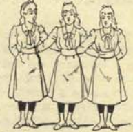
1.—Asociación política femenina vista por delante.

Se habla con insistencia de que quizá la ansiada apertura asociacionista empiece antes de lo que unos temen y otros desean. Nosotros, sin poner ni quitar Rey, pero ayudando a nuestro señor, ofrecemos las siguientes instantáneas, obtenidas recientemente en Valencia.