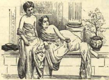
3. Un fotograma de una de dichas películas.