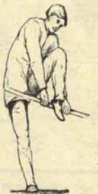
5. El medidor económico intentando (en vano) contener un precio con tensión alcista.