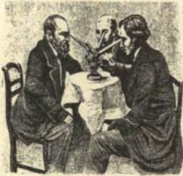
2. Alumnos de la Facultad de Filosofía contemplando extasiados una película pornográfica.