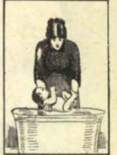
2. Déjese gotear el ácido durante unos segundos.