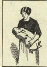
3. Envuélvase en una toquilla corriente.