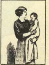
4. ¡Y ya está! Así no sufrirá usted las molestias y quemazones producidas por el ácido. ¿Ve qué fácil?