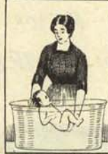
1. Extráigase al niño de la cubeta c/3 ácido sulfúrico con grandes precauciones.

—Muy fácilmente —nos ha contestado nuestro asesor pediátrico, doctor Spock—, así: