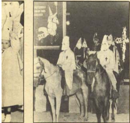
...Todo hace ...ta es lo que ...miembros de ...endo. Un escuadrón del Quinto de Caballería del Ku-Klux- Klan, portando una cruz en llamas, en el mo- mento de salir desde Carolina del Sur (USA) hacia Valencia (España) para participar en las Fallas.

P OR fin, y tras numerosas ges- tiones de alto nivel, va a ser inaugurado el primer parque nacional para negros, en la acre- ditada zona veraniega de La Calette. Se pretende con ello preservar a un negro de cada especie de la segregación y, por tanto, de su posible extinción. Las reglas para los visitantes serán severísimas, y sólo se per- mitirá arrojarles alimentos de los que figuren a la entrada del parque, anunciados en el tablón dietético de la semana.