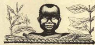
(MISCELANEA DE LA SEGREGACION)

atravesaban nuestro país, cami- no de puestos de trabajo en la Europa Central, ha movido a la creación de una cañada para negros señalizada en blanco. Po- drán circular por ella todas las gentes de color que tengan los doce certificados de garantía, las veintidós vacunas y el co- rrespondiente pasaporte, tal como especifica el régimen de