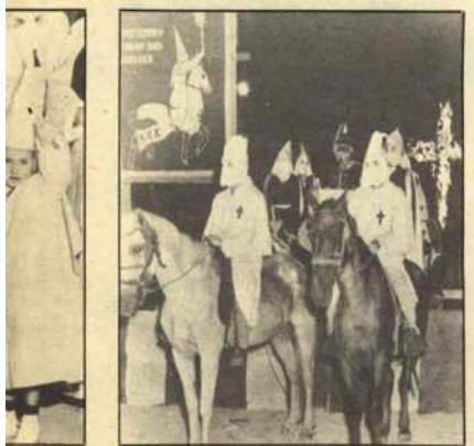
—Todo hace tiempo que es lo que miembros de endo. Un escuadrón del Quinto de Caballería del Ku-Klux- Klan, portando una cruz en llamas, en el mo- mento de salir desde Carolina del Sur (USA) hacia Valencia (España) para participar en las Fallas.

P OR fin, y tras numerosas ges- tiones de alto nivel, va a ser inaugurado el primer parque nacional para negros, en la acre- ditada zona veraniega de La Calette. Se pretende con ello preservar a un negro de cada especie de la segregación y, por tanto, de su posible extinción. Las reglas para los visitantes serán severísimas, y sólo se per- mitirá arrojarles alimentos de los que figuren a la entrada del parque, anunciados en el tablón dietético de la semana.