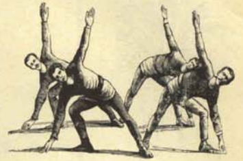
1.—Derechas e izquierdas, buscando las cenizas de sus antepasados para arrojarlas a la cara de sus contrarios.

Cualquier cabeza regularmente calva sabe que el centrismo es la solución a muchos de nuestros males. Demostración: