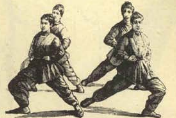
2.—Derechas e izquierdas femeninas, aprestándose a poner huevos para perpetuar sus especies.