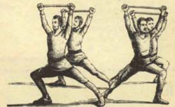
3.—Derechas e izquierdas, esgrimiendo razones.