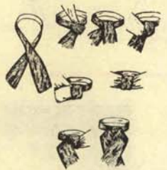
3.—Ibidem de plastrón.