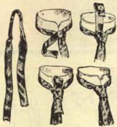
2.—Id. de chalina.