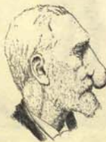
Señor con nariz de husmear rumores.