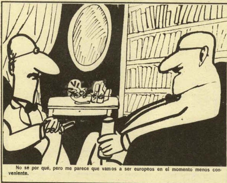
No sé por qué, pero me parece que vamos a ser europeos en el momento menos conveniente.