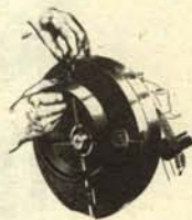
2. Operarios realizando la transformación.