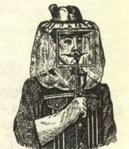
Respirador independiente para ir en el metro.