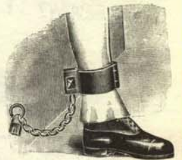
Grillete para atar a nuestras hijas a la cama, al lado de su mamá, que deberá tener la pierna quebrada.