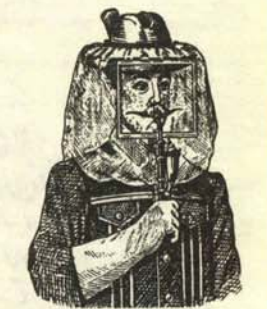
Respirador independiente para ir en el metro.