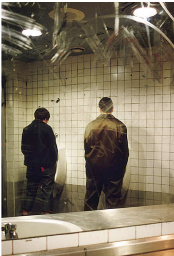
Cabello / Carceller, Autorretrato como fuente , 2001

En Espacios de poder (2005) varias mujeres interpretan papeles masculinos extraídos de películas como La lista de Schindler o El apartamento . Estas imágenes dejan ver la artificiosidad de la virilidad fílmica a la vez que demuestran cómo una mujer puede ostentar el mismo rango de poder que un hombre. De este modo se pretenden superar las rígidas categorías de lo masculino y lo femenino dejando ver cómo el género es siempre una copia sin original. En palabras de Jesús Martínez Oliva: “La masculinidad femenina lejos de ser una imitación de la masculinidad nos hace vislumbrar cómo la masculinidad "verdadera" es construida como tal. La masculinidad femenina es uno de los componentes que enmarcan la masculinidad normativa; son algunos de los residuos rechazados por esa masculinidad dominante, para hacer que ella parezca la real y la auténtica” 21 .