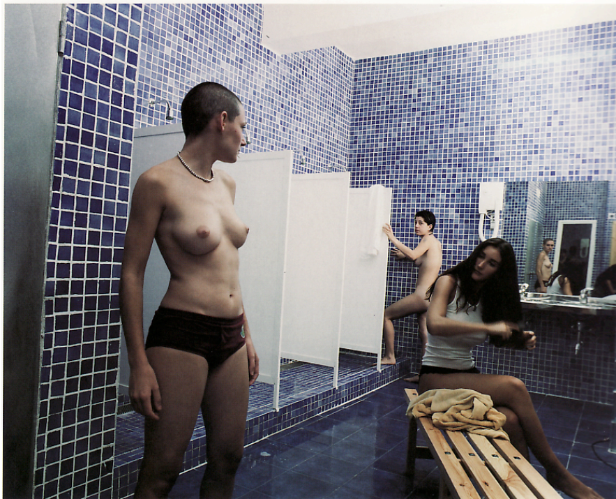
Carmela García, Sin título , 2000

También en la obra del dúo artístico Cabello / Carceller (París, 1963 / Madrid, 1964) encontramos una reflexión acerca de las relaciones entre mujeres, la representación del deseo y la masculinidad femenina. A lo largo de su carrera estas artistas han trenzado una obra multidisciplinar partiendo de su doble relación laboral y sentimental ( Un beso , 1996; Identity game , 1996; Silencios , 1996). En Autorretrato como fuente (2001) vemos dos espaldas reflejadas en el espejo de unos urinarios públicos. Dos figuras aparentemente masculinas orinan sin que podamos ver sus genitales. Por este motivo dudamos. No sabemos con certeza si se trata de dos hombres, un hombre y una mujer, dos mujeres... (¿las artistas, tal vez?). La segregación urinaria, que ya veíamos subvertida en la obra de Okariz, queda obsoleta como método de demarcación sexual. Una mujer (no necesariamente lesbiana) puede ser lo suficientemente masculina como para entrar en unos aseos públicos de hombres y orinar sin levantar sospecha. Entonces las jerarquías que correlacionan sexo y género se desmoronan. La masculinidad no se agota en el pene, ni en el simbolismo fálico, ni por supuesto en la longitud del pelo o en el atuendo, sino en toda una serie de factores que condicionan las relaciones de poder entre sexos.