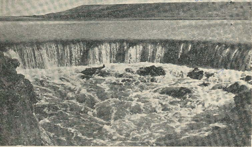
Esta parcial de la Nava. Excavación verificada para dar salida de las aguas al canal principal. Al fondo el páramo de Autilla.