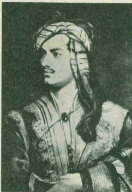
NUEVO RETRATO DE BYRON VESTIDO CON EL TRAJE ALBANÉS, ESTA VEZ DEBIDO A THOMAS PHILLIPS, QUIEN LO PINTO EN MARZO DE 1814, CUANDO EL ESCRITOR CONTABA VEINTISEIS AÑOS.

deres de los diferentes grupos. En septiembre, Browne y Trelawny son enviados para reunir auténtica información sobre los conflictos, pero Trelawny —envidioso y descontento—, después de unas placenteras semanas en Hydra, decide unir su suerte al jefe de los bandidos, Odysseus, con el que parte en una expedición de caza. En octubre, Browne vuelve junto a Byron con dos diputados griegos que representan a Mavrocordato, probablemente el líder más digno de crédito.