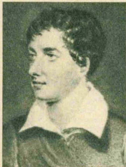
ENTRE LA ABUNDANTE ICONOGRAFIA DE LORD BYRON QUE HA LLEGADO HASTA NOSOTROS, DESTACA ESTE RETRATO EN MINIATURA QUE LE HICIERA JAMES HOLMES. DE EL SE SACO UNA COPIA QUE EL ESCRITOR ENTREGO A SU HERMANASTRA, AUGUSTA LEIGH.

La posible compra de Newstead fracasa. Byron se ve acosado por sus enredos financieros y sentimentales. En junio, lady Oxford parte al extranjero. Byron ha reiniciado su relación con su semihermana, casada ahora con un manirroto y madre de una familia que va en aumento. En julio, Caroline provoca nuevas habladurías al protagonizar una histérica escena en un baile. Byron se prepara afanosamente para dejar el país, pero pronto le comunica a Moore que está comprometido