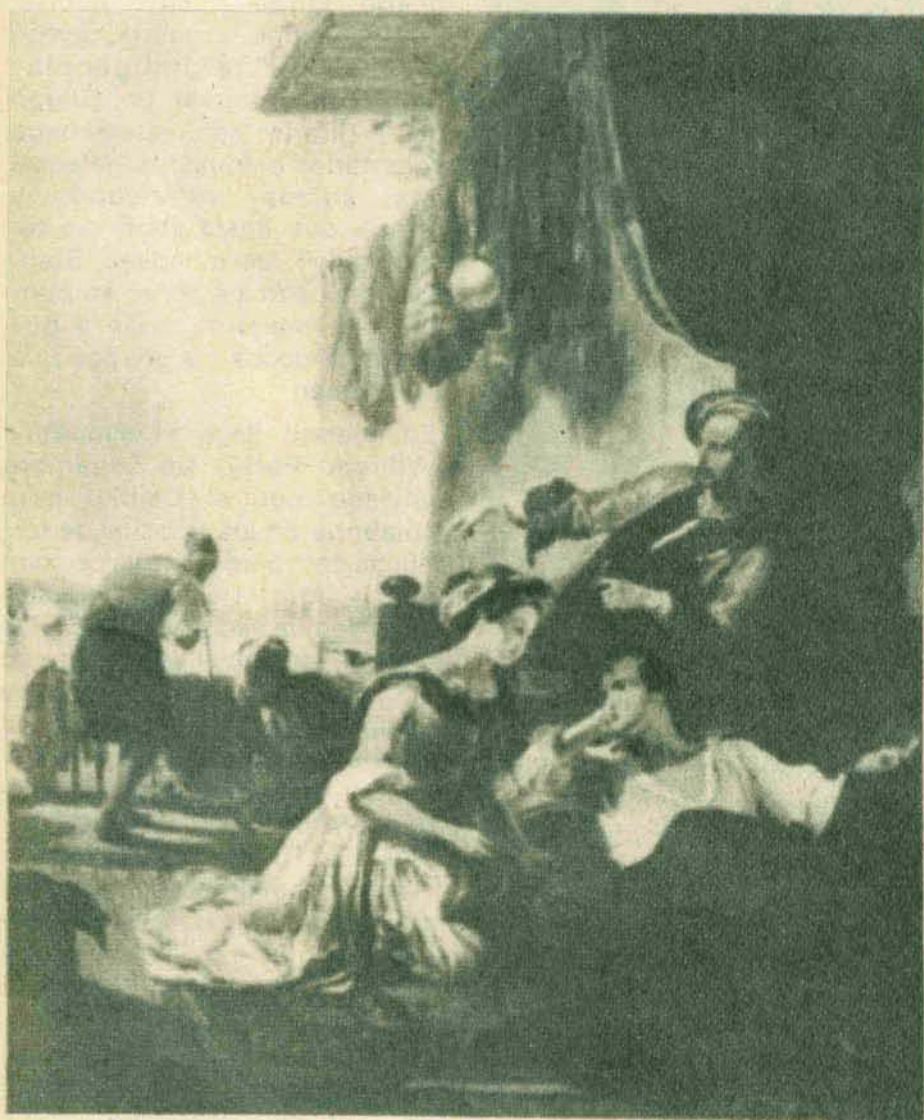
«LORD BYRON REPOSANDO EN LA CASA DE UN PESCADOR TURCO DESPUES DE HABER NADADO DE UN LADO AL OTRO DEL HELESPONTO». EL CUADRO DE WILLIAM ALLAN SE REFIERE A LA TRAVESIA A NADO QUE, DE LA COSTA EUROPEA A LA ASIATICA DEL ACTUAL ESTRECHO DE LOS DARDANELOS, HICIERA EL POETA EL 3 DE MAYO DE 1816.

En mayo se decide que Byron parta hacia Grecia, y el hermano de Teresa se anima a acompañarle. Teresa está desesperada. Se invita a Trelawny, considerado como un hombre de acción con experiencia, a sumarse a la expedición. Acepta ilusionado, pero permanece cinco semanas en Florencia, cortejando a Mrs.