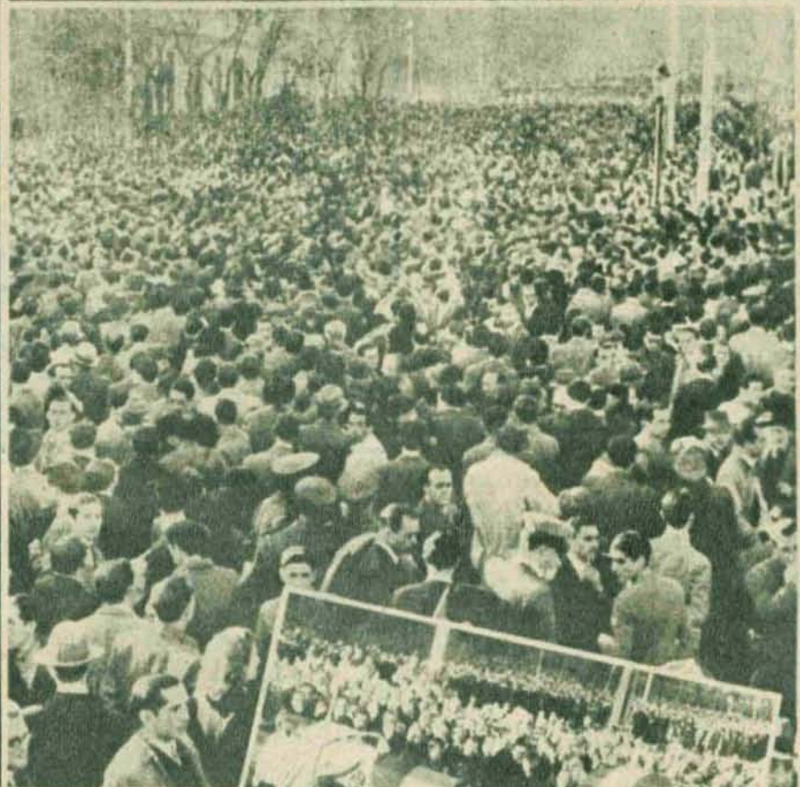
UNA IMPONENTE MANIFESTACION DE DUBIO

FUNDADO EN 1905 POR D. TORCUATO LUCA DE TENA