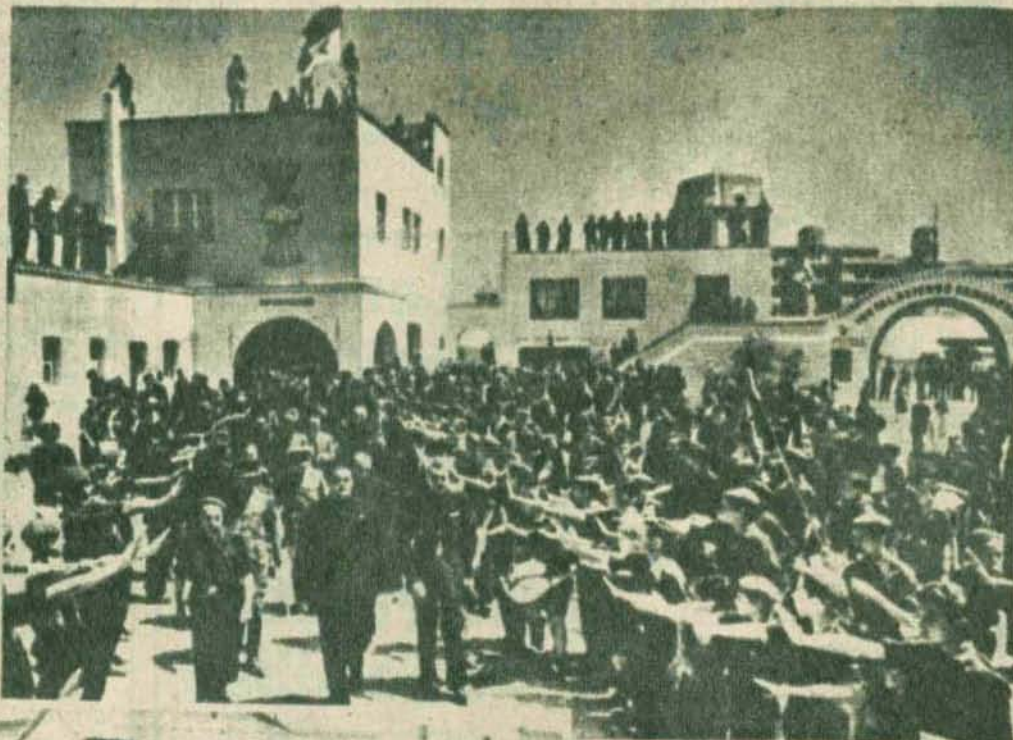
El ministro de Trabajo, camarada Girón, visita las viviendas protegidas en Valencia

—Me ha preocupado mucho—nos dice el ministro— en toda su actividad, el problema minero. No es que estos trabajadores se diferencien en calidad de los que rinden a la Patria idénticos servicios en esfuerzos diferentes pero igualmente meritorios. Lo que pasa es que en el trabajo de los mineros concurren