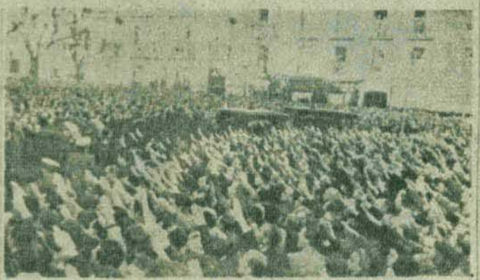
La salida de la importante manifestación que ha conmovido al pueblo de los fallecidos asesinados