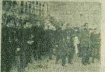
El féretro en plena vía de la procesión del duelo