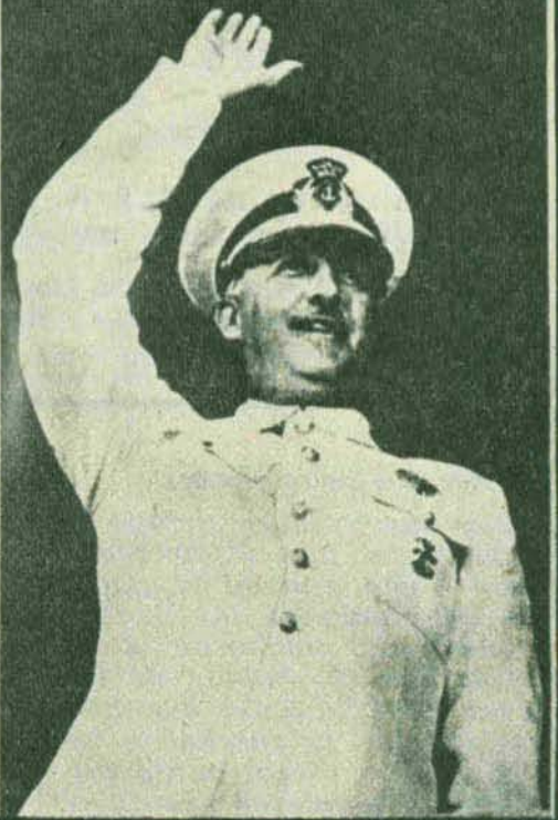
(“Juventud”, extra fin de año 1944.)

Estamos con Franco porque sabemos que es el gran gobernante de la Historia de España, y porque sólo él, en esta hora trágica que atraviesa el mundo y que nubla la vista de los primeros políticos del mundo entero, ha sabido conservar la hidalguía, el valor y la fortaleza del mando para conducir a España por el camino de su restauración y su grandeza.