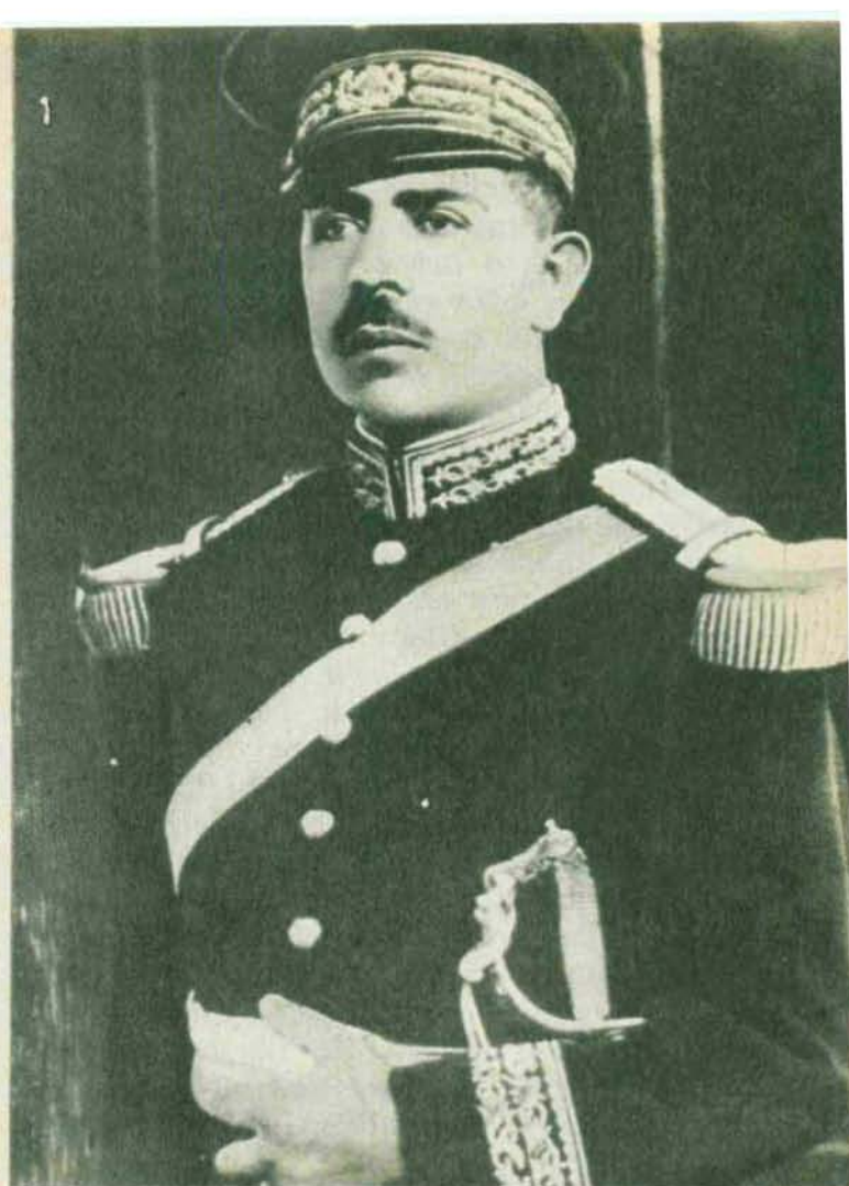
EL VELO QUE SE MANTENIA SOBRE EL CARGAMENTO DEL "VITA" HA DURADO AÑOS, Y SOLO AHORA COMIENZA A SER LEVANTADO. HASTA EL PRESIDENTE MEXICANO DEL MOMENTO, LAZARO CARDENAS, (AL QUE VEMOS) SE LIMITO A ESCRIBIR EN SU DIARIO EL RECORRIDO EFECTUADO POR EL YATE.

Hasta 1942, la JARE administra los fondos del "Vita", pero a finales de ese año interviene decisivamente en el asunto el gobierno