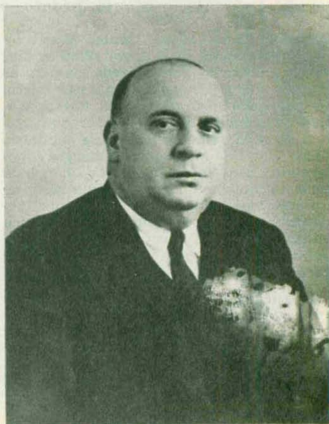
INDALECIO PRIETO, QUE «IGNORABA COMPLETAMENTE EL ASUNTO», RECIBE EN MEXICO EL CARGAMENTO DEL «VITA». SEGUN JOSE FUENTES MARES, «GRACIAS AL TESORO QUE CONTENIA EL BARCO, VOLVIO A SER DE NUEVO EL NUMERO UNO» ENTRE LOS POLITICOS ESPAÑOLES EN EL EXILIO.