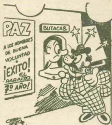
LOS EXIGENTES, por Orbegozo.

—No. Si se trata de una película de amor, no entro. A mí me gustaría una de crímenes, revolución, robos y saqueos. Y que la acción ocurriera en España.